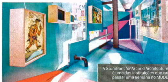
A Storefront for Art and Architecture é uma das instituições que vai passar uma semana no MUDE