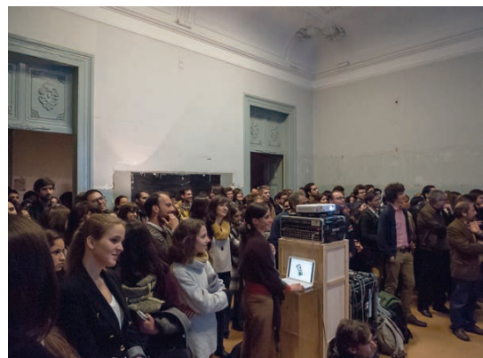
Anúncio vencedores _2.jpg