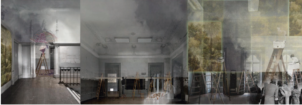
Colectivo Inventado_Fábrica de Sonhos.jpg